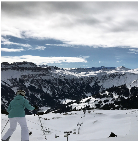
Wintersporttage in den Flumserbergen