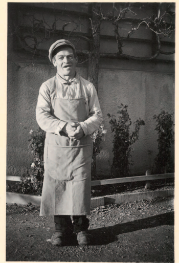
Auszug aus dem Typoskript «Die Lage der Taubstummen im Alter von über fünfzig Jahren in den Kantonen St. Gallen und Appenzel», einer Diplomarbeit der Sozialen Frauenschule Zürich (1950). 49 der 55 vorgestellten Gehörlosen hatten die Taubstummenanstalt St. Gallen besucht.